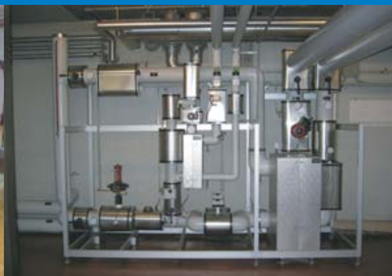
■ platzsparende Wärmeübergabestation in einer der angeschlossenen Liegenschaften