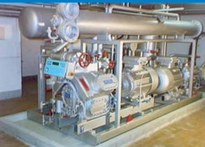
■ Elektrowärmepumpe in der Heizzentrale nutzt die Wärme aus Grundwasser

Gerne stellen wir Ihnen den Wärmeverbund Marzili Bern näher vor und beantworten Ihre Fragen in einem unverbindlichen Gespräch.